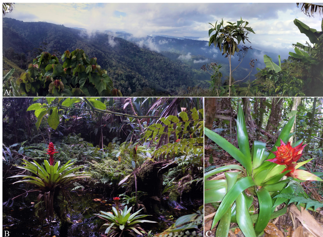
Figura 2. A. Panorámica de los bosques nublados de la Sierra de Aroa, sector Cerro El Tigre, Parque Nacional Yurubí, Yaracuy, Venezuela, B. Localidad de colecta en el Cerro el Tigre: se muestra la zona de la laguna y las epifitas Guzmania cylindrica , C. Detalle de una planta de Guzmania cylindrica en el área de muestreo.