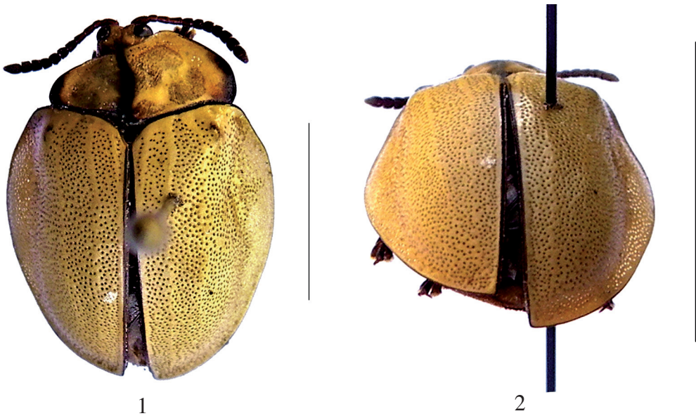
Figuras 1-2. 1. Distrofia lateral del pronoto en ejemplar macho de Zatrephina lineata (Fabricius). 2. Hemibraquielitría en el mismo ejemplar. Escala: 5 mm.

Descripción. Considerando el plano sagital corporal, la distrofia del pronoto abarca el lado izquierdo que, de acuerdo con la terminología propuesta por Balazuc (1948), se correspondería con una hemiatrofia del pronoto. Por lo general, la cabeza hipognata de este tipo de coleópteros (llamados escarabajos tortuga), está parcialmente cubierta por el pronoto. En función de la hemiatrofia pronotal, el ejemplar presenta la cabeza mayormente expuesta y no le limitó la condición motil ni filófaga. Este escarabajo también exhibe una braquielitría o disminución anormal de los élitros (Balazuc 1948). En el caso estudiado, la braquielitría se presenta en el élitro izquierdo correspondiendo, por lo tanto, a una hemibraquielitría (Balazuc 1948) manteniéndose sin alteraciones el tegumento, forma y coloración.